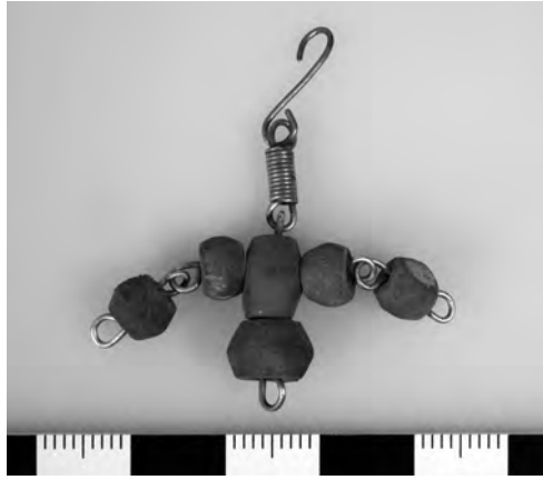
Figura 10 Fragment d'un penjoll de corall localitzat a la tomba de Jaume II i Blanca d'Anjou i atribuït a l'aixovar funerari de la reina.

Per altra banda, entre els nombrosos elements que es barrejaven amb les restes de Blanca d'Anjou dins la tomba, es recuperà un fragment d'una joia de corall, possiblement associada a l'ornamentació personal i funerària de la reina. Es tracta d'un fragment d'una peça en forma de creu constituïda per petites denes de corall lligades amb un fil d'aliatge de coure i plata i que correspon a un element complementari que deuria haver format part d'un penjoll difícilment identificable en la seva forma completa. La presència d'elements ornamentals de corall és plenament coherent amb les dades documentals que indiquen que el rei Jaume II, marit de Blanca d'Anjou, va mostrar al llarg de la seva vida un gran interès en la compra d'elevades quantitats de corall i que va haver-hi un comerç fructífer d'aquest material a la costa empordanesa.