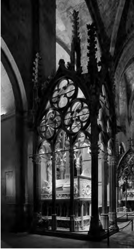
Figura 3 Tomba de Jaume II el Just i Blanca d'Anjou, construïda entre 1312-1316.

Els treballs de restauració han posat de manifest la inexistència de restes de policromia gòtica i l'extraordinària conservació i netedat de la superfície de la pedra tallada, amb les traces ben definides de les eines de l'escultor, dades que permeten concloure que es tracta d'una obra inacabada, atès que no es va portar a terme el policromat de les estructures, fet completament inusual per a l'època.