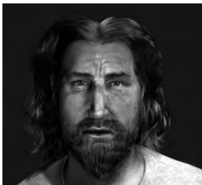
Figura 6 Proposta de restitució facial del rei Pere el Gran, a partir de l'estudi del crani. Foto: MHC (Philippe Froesch-Estudi PF).

S'han dut a terme els estudis tipològics i toxicològics de mostres de cabells del rei Pere II el Gran recuperats durant el procés d'actuació sobre les restes, així com l'anàlisi d'una mostra del manyoc de cabells identificat sota el far-dell funerari. Els objectius d'aquestes analítiques pretenien obtenir informació sobre les característiques morfològiques del cabell de Pere, l'anàlisi toxicològica per identificar possibles intoxicacions o enverinaments i l'existència de tractaments a base de productes cosmètics.